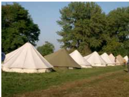
Áll már a tábor