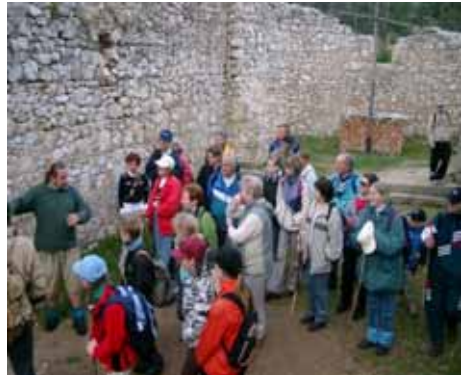
A Vörös kolostor romjai között

Korán keltünk, de megérte... A két órás út után már mindenki nagyra várta, hogy mit hoz nekünk a mai nap! A lelkes társaság még a szemerklő esőtől sem riadt vissza! Az idősebb korosztály egy könnyebb terepet választott, míg a csapatunk kisebb tagjai velünk tartottak a néhol veszélyes, és nehéz létrák megmászása között!