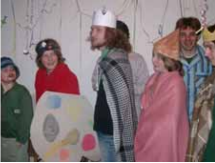
A Tatu őrs Süsü jelmezébe bújt

Rendszerint a csapat évente két tanyázást szervez. Ez egy hétvégi program, ahol együtt vagyunk csak mi, a csapat. Hogy még érdekesebbé tegyük, minden tanyázásnak más keretmesét találunk ki. 2005-ben és 2006-ban Jászóváron, Ájfalucskán (Hačava) és Debrődön töltöttünk el egy pár napot. A tanyázásaink folyamán rengeteget szórakozunk, egyszerűen jól érezzük magunkat így együtt.