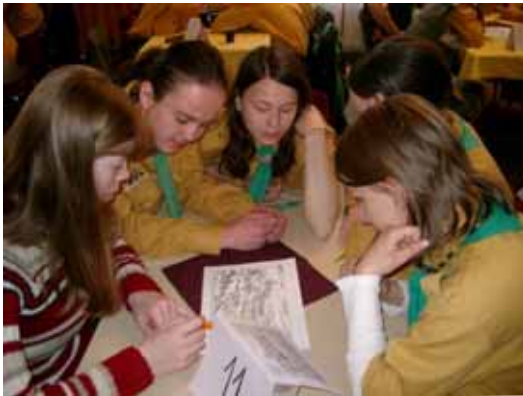
A győztes szépsi versenyző csapat

A vendégek és egyben a versenyzők részére még jutott időnk arra, hogy összeállítsunk egy kis éjszakai városi portyát. Feltételezem, nagyon örültek neki, de jól teljesítették a feladatokat, és megismerték városunk nevezetességeit. (Megjegyzem a mi kis városunkban ez nem is volt túl nehéz). Miután lefeküdtek, mi is hazamentünk kipihenni a nap fáradalmait.