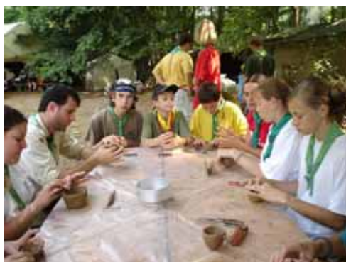
Agvagoznak az ügyes kezek