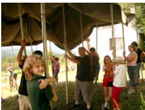
Épül a nagysátor