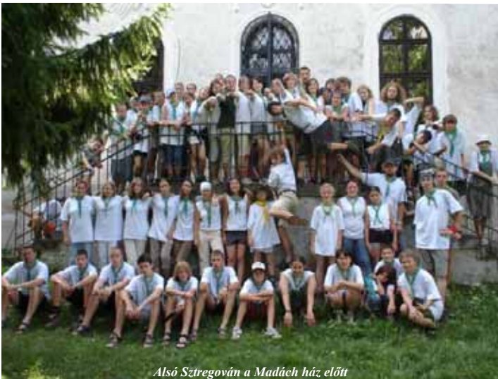
Alsó Sztrégován a Madách ház előtt

cseh jégkorongmérkőzést is eljátszunk, persze csak fűvön:) Annyi biztos, hogy emlékezetes tábor marad mindannyiunk számára, mivel a gesztei csapattal azóta is nagyon jó a viszony, továbbá sokszor emlegetjük még a tábori emlékeket, és énekeljük a "Prši, prši jen sa leje" dalt.