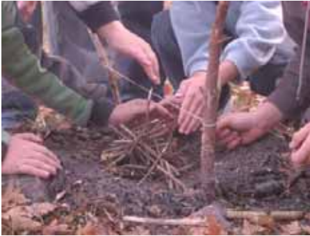
Egy gyufával meggyullad a tűz