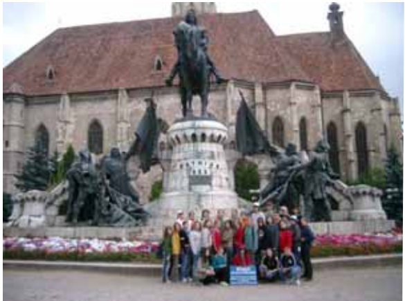
Kolozsvárott a Mátyas szobor előtt

került Nagyvárad, Kolozsvár, Torda, Nagyenyed, Marosvásárhely, Székelyudvarhely, Segesvár, Gyulafehérvár, Déva, Arad és Temesvár. Hosszú lenne felsorolni mindazt a helyet, mely napirenden volt. Jöhetett eső, égethetett a nap, a jókedv sosem lankadt. Hazafelé még Szegedet és Ópusztaszer is megnézhetjük.