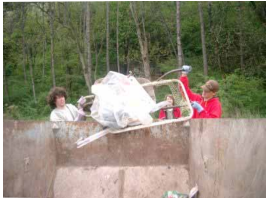
Gyorsan megtelt a konténer....

Ezért a szeptsi cserkészek kis csapata 2006. április 22-én a városi hegyre vezető kanyargós lépcső (szerpentin) környékén szedett szemetet. Igaz, a szeptsi iskolások is meg voltak szólítva, de a reggeli találkozásnál a cserkészekén kívül más nem volt jelen. Néhány perccel a kezdés előtt még javában szakadt az eső, de a megbeszélte időponttól már az időjárás sem gátolta a munkát. Sajnos, a helyszínre hozott 5 tonnás konténer hamar megtelt. Dicséretes a lelkesedés, hisz a szemétszedés egyike az olyan munkáknak, ami tulajdonképpen reménytelen. A szemétszedés hasonlít a betegséghez, melynél nem a gyógyításra, hanem a megelőzésre kell tenni a hangsúlyt. Mert lehet, hogy nem a szemét a szemét, hanem az, aki kidobja. Az apró csapat lelkes munkáját látva, és az eredményről hallva több városlakó kérte, a csapat szervezzen egy újabb ilyen akciót, amelyhez a hegyen lakók ígérték segítségüket a környezetük rendbetételéhez.