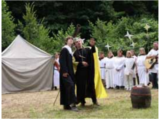
Kepler és II. Rudolf mereng a csillagok állása fölött – részlet a prágai jelenetből

Csapatunk a nyitrai gesztei és ipolysági csapattal együtt a prágai színt képviselte. A tábor eseményeiről a Najesa (Nagytábori jegyzetek a Csali völgyből) újságban olvashattunk, amely naponta jelent meg. Mi, prágaiak befogtunk az Orloj megépítésébe, amely pár napon belül el is készült, sőt egy napórát is kapott. Amikor a Prši, prši... kezdetű dalba fogtunk bele, még nem sejtettük, hogy pár napon belül bőrig fog ázni minden altábor. (Volt, akiknek el is kellett költözni egy kis időre). Ám az eső sem tudott minket meggátolni abban, hogy a prágai napon előadjuk Kepler és Borbála történetét, valamint egy