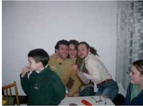
A vidám roverek

A tavaszi tanyázás a közelgő próbázásra készüléssel telt, de egy szádelői túra, sok játék és „minden ember ember...” dal is belefért a hétvégébe. Aktuális hagyományt is felelevenítettünk, pütkösdi királyt választottunk, amit kemény próba előzött meg.