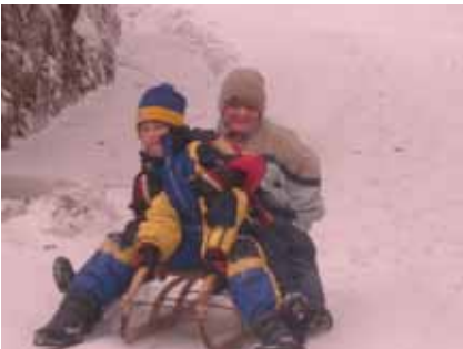
Egy Űrge és egy Puma őrstag lesiklás közben