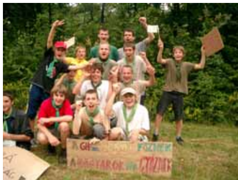
Egy lelkes szurkolótábor