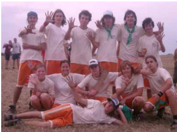
Az 5. győztes versenynek örülő bajnok csapat