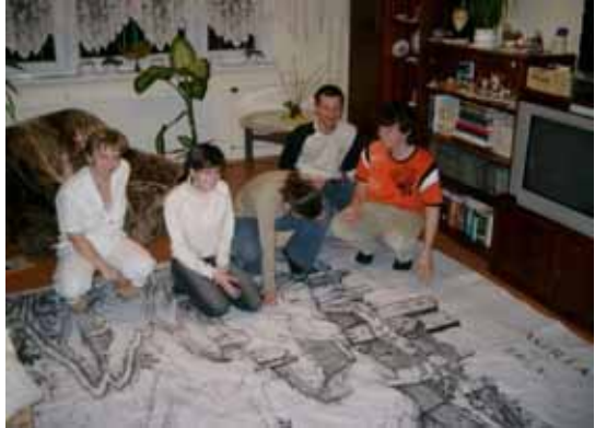
A csapatparancsnok lakásán készül a nagyméretű egri vár látképe

A X. országos történelmi vetélkedő szervezését a szépsi cserkészcsapat vállalta magára, amelyre 2005. március 18-19. között került sor. Nagy izgalommal díszítettük a helyi kultúrházat a várva-várt napra. Csak úgy repkedtek a jobbnál jobb ötletek, mit hogyan csináljunk, hová tegyük, pl. a színpadon tábori sátorból, anyagból és párnákból török sátor készült. Háttal a falon pedig az egri vár és az Egri csillagok című film kockái feszültek 3 x 4 méter méretben.