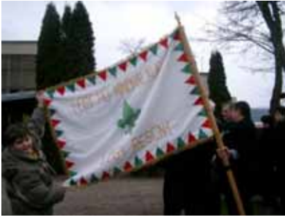
Csapatzászlónk az 1992-es fogadalmiételre készült. Egyik oldalán két jelszó olvasható: felül Bercsényi kuruc generális és alul a cserkészeké

A csapat élén a csapatparancsnok áll, aki felel a csapat mindennapi munkájáért, őt a csapattisztek, vagyis a felnőtt vezetők segítik. Ezek a vezetők mind az SZMCS által szervezett vezetőképző táborokban szerzik meg a kellő tudást, de a lelkesedésüket és az állandó tenni akarásukat a saját lelkiismeretük, meggyőződésük és a tisztfogadalmuk hajtja.