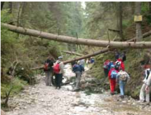
Az életet adó víz

a nap is kisütött. Miután jóllaktunk, összepakoltunk és elindultunk lefelé. Nagyon jól éreztük magunkat, és remélem, még lesz olyan szerencsém, hogy újra eljussak erre a szép helyre!