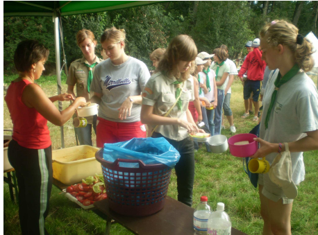
Mi éhesek vagyunk, mi enni akarunk...