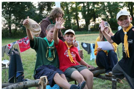
Jó munkát fotós bácsi!