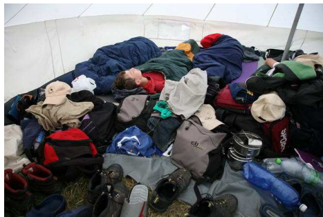
Ezt nem Bea csinálta ☺