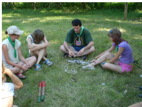
A csomózás alapkövetelmény