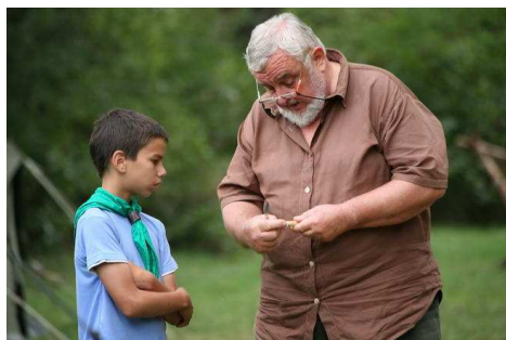
Pista bá sípot farag és ajándékoz