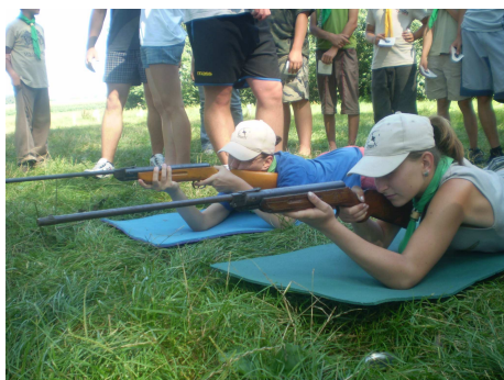
Mozgó célpontra „nem” lövünk ☺