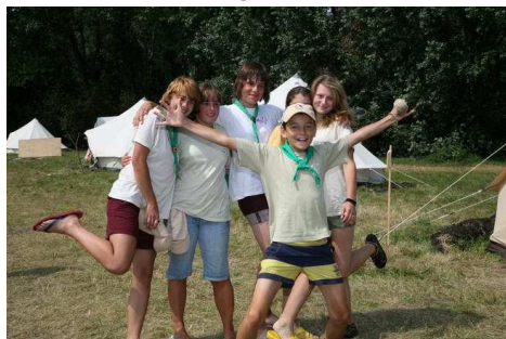
Bújjatok el, takarlak!