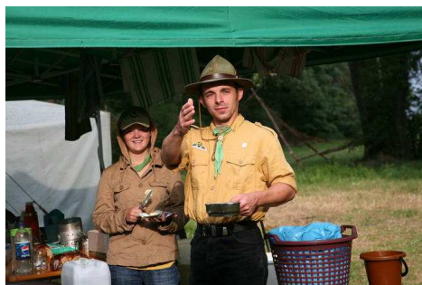
Hát igen ... ☺