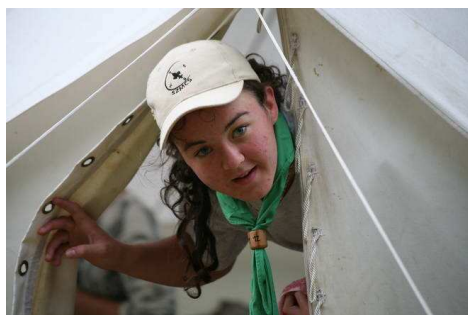
Felkészültünk a sátorszemlére