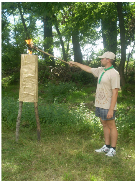
Az olimpiai láng meggyújtása: 08.08.08.