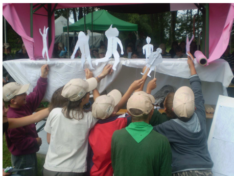
Ez egy tábori kosárlabda meccs ☺